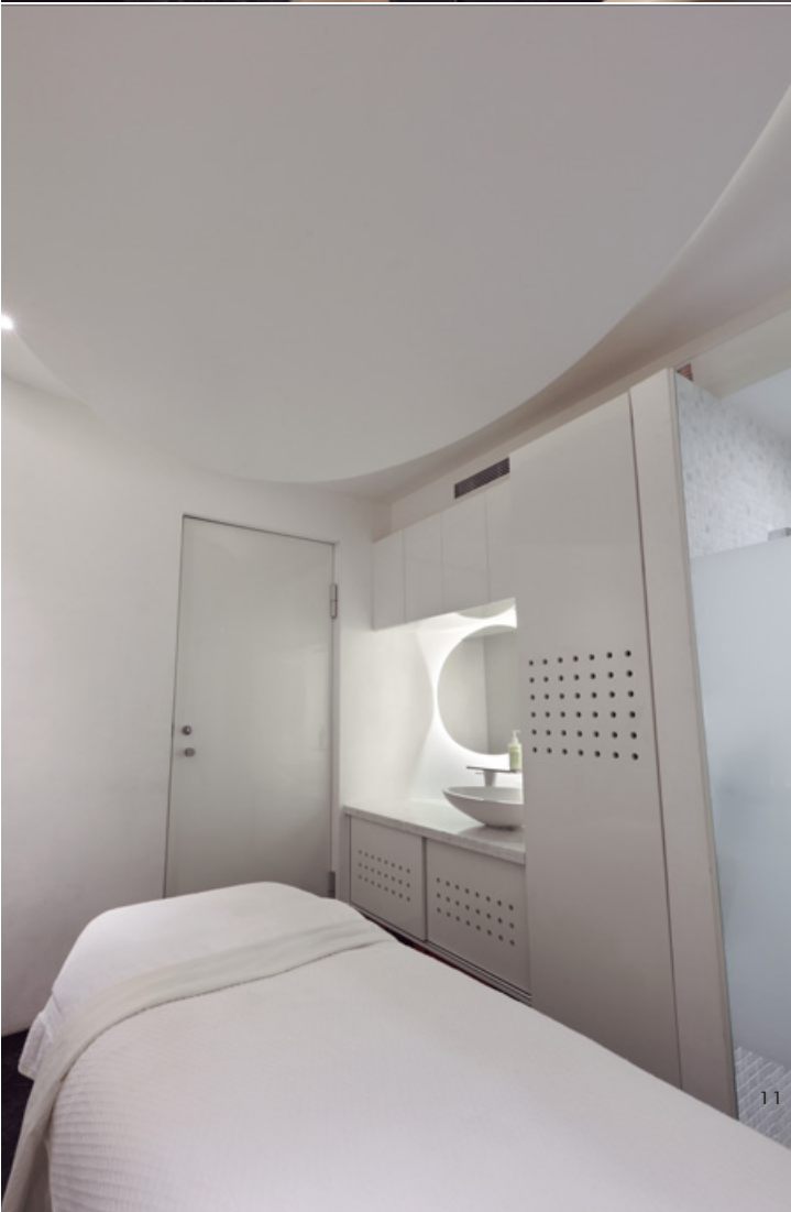
9. 牆上的色彩襯托出空間的俐落。10. 洗手間門把也要維持有機線條。11. 療程室內改以凸型的卵石型天花。12. 鏡子與面盆延續空間語彙。13. 連牆面也要呼應卵石型的曲線。