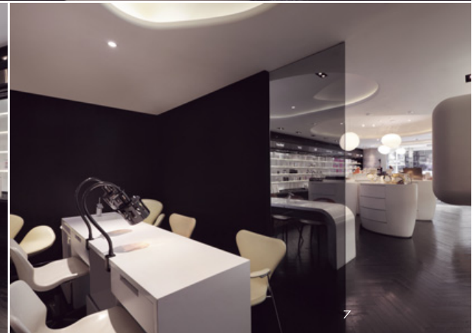
4. 象徵精品的黑色櫃區。5. 天花、燈具、中島、光板連續成一道室內風景。6. 椅子與地板紋路為空間增添自然的溫度。7. 黑玻璃為長型空間創造穿透與不穿透的曖昧。8. 美甲區在牆上鑲入繽紛的指甲油。