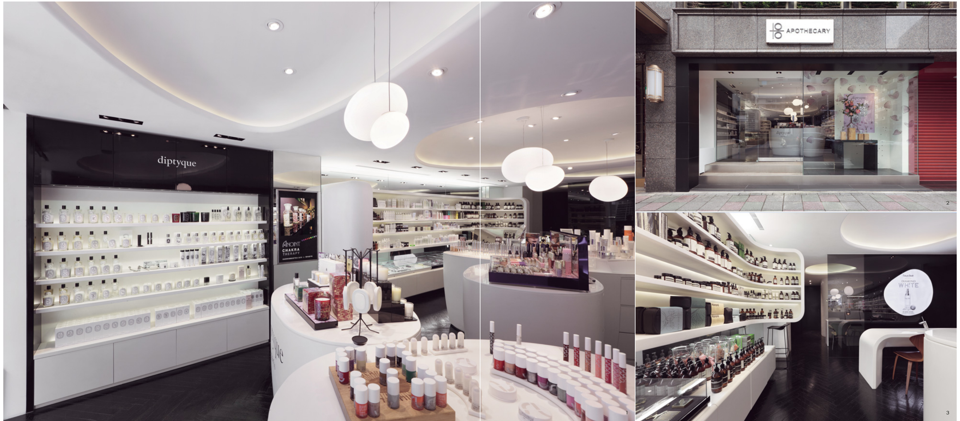
1. 卵石型的線條為黑白空間帶來有機質感。2. 乾淨低調的店面。3. 象徵生活的白色櫃區。