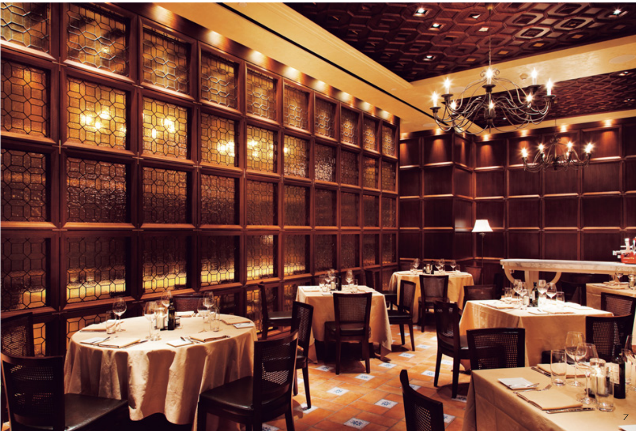
6. 平面圖。7. 特意拉開餐桌距離，滿足各桌賓客的交談隱私以及侍酒與桌邊服務所需的空間。8. VIP包廂細部。9. 天花板的繩索編織浮雕木板與玫瑰金古銅吊燈流露義式古典風情。10. VIP包廂透光的玻璃牆面，也是餐廳裡視覺焦點。