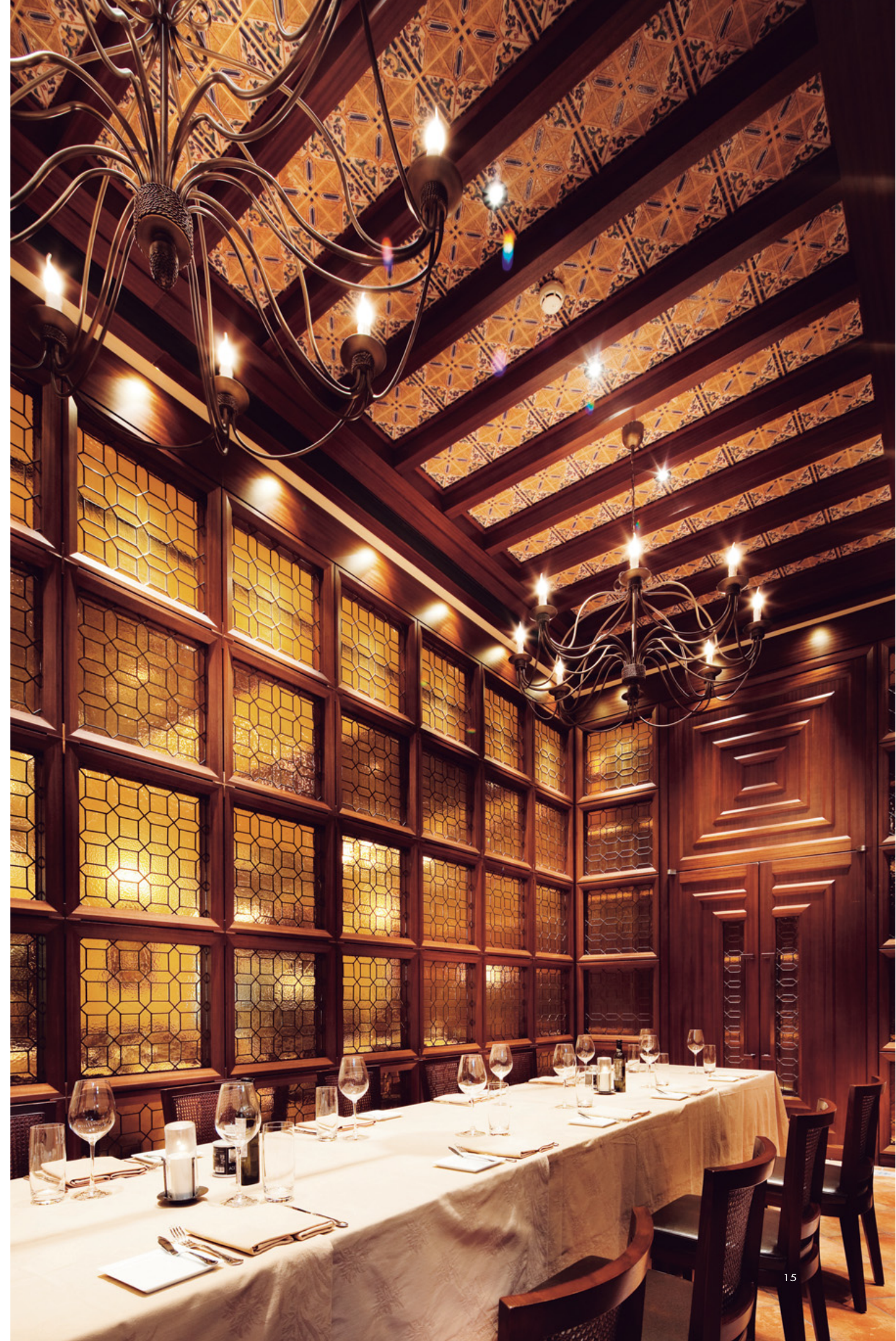
11. 長型而挑高的包廂空間，隨著玻璃的透光效果而褪去窄迫感。12. VIP包廂，在水紋玻璃的中介下讓內外視景產生朦朧效果，維繫了包廂內部的隱私。13. 洗手間。14. VIP包廂以木質、鑲嵌玻璃、復古磚圍塑，流露濃濃的歐式古典風情。15. VIP包廂延續蔓藤結構吊燈作為裝飾元素。