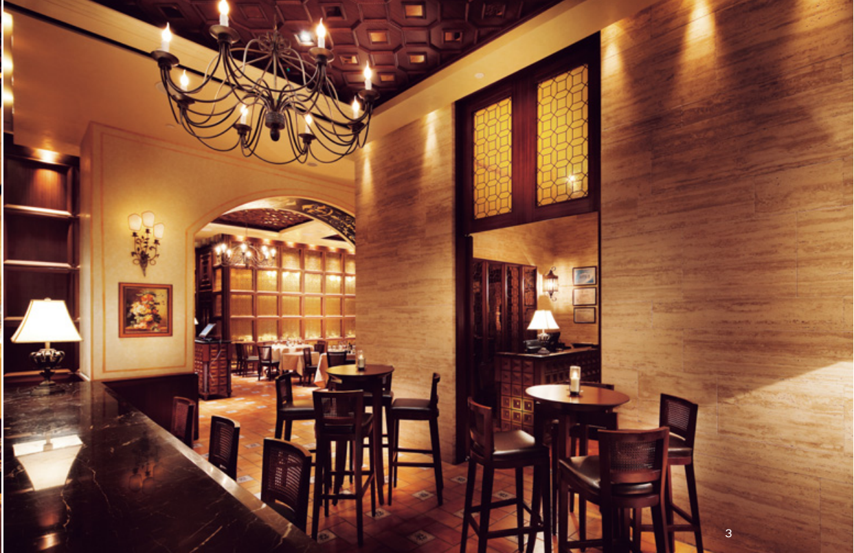
2. 考究Sabatini羅馬總店的古典鄉村風格，採用義大利洞石、復古磚、立體浮雕木板鋪砌空間。3. 餐廳內部利用動線轉折，創造層層探索的驚喜。4. 藉由基地既有樑柱增建成拱廊造型，讓拱柱優雅的輪廓分割出前後段的用餐區。5. 穿梭門廳動線抵達吧台區，這裡也是餐前酒、交誼放鬆的空間。