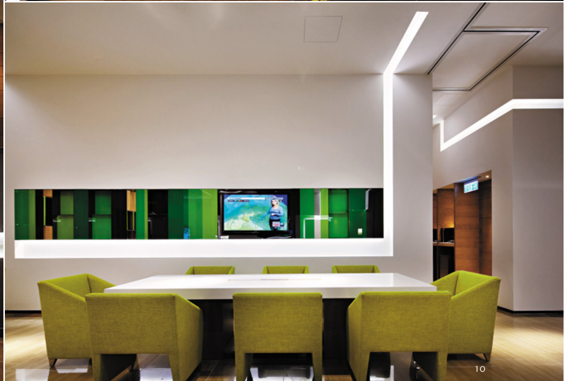
8. 光軌不規則的穿錯於天花板與立面中，俐落的劃定了場域範疇並消化照明設備。9. 以灰鏡、木作編組的造型牆，從不同角度觀看皆有變化。10. 會議空間配以液晶螢幕，提供小型會議的舒適場域。11. 17-20樓平面圖。12. 21-27樓平面圖。