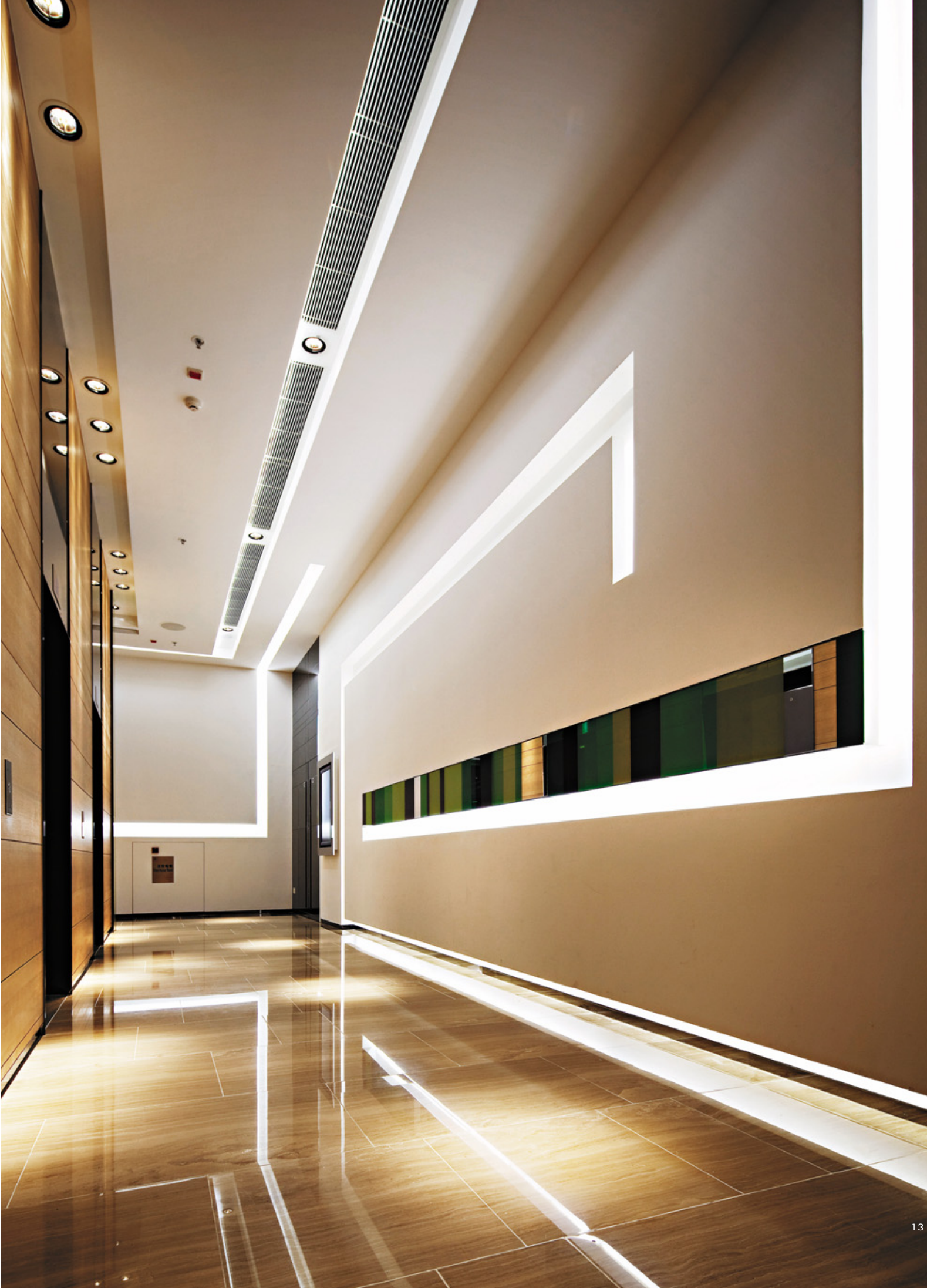
13. 一樓電梯區，延續大廳的光軌與色塊元素，讓長廊空間顯得簡潔明亮。14. 電梯內部使用反射材質，拓展空間感。15. 廊道延續了大廳的光軌與色塊元素，以低限的裝飾語彙引導旅客行進方向。16. 客房以一道起伏的平檯複合入行李層板、梳妝檯、電視櫃、辦公桌等設備。17. 浴室。