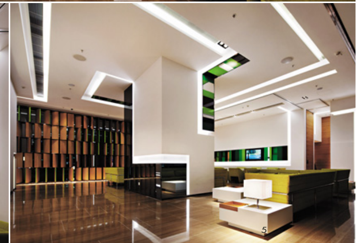
2. 以柱體為中心，利用沙發坐向區別出洽詢、會議、會客等不同的座區，讓賓客都能直覺性的找到符合需求的位置。3. 炫亮的光軌意味著城市脈動以及川流不息的速度感，呼應了旅人探尋都會的活力與熱情。4. 會議空間平日開放，有特殊需求時可展開活動牆，即能圍塑出獨立的會議室。5. 大廳中央的結構柱利用烤漆玻璃、灰鏡鋪陳四面各具特色的表情。6. 地面層平面圖。7. 10-16樓平面圖。