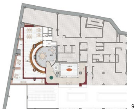
8. 深酒紅色的沖孔鋁板界定了大西山的立面與造型。9. 平面圖。10. 利用懸挑、透視與光帶讓空間整體顯得輕盈。11. 大西山裡由圓弧形吧檯桌主導著生活區的各项活動。12. 吧檯桌是咖啡、茶、酒、閱讀、香道、花道、盆景與品食的聚點。13. 場域分而不隔，因應活動需求可彈性界定範疇。14. 立面圖。15. 軸測圖。