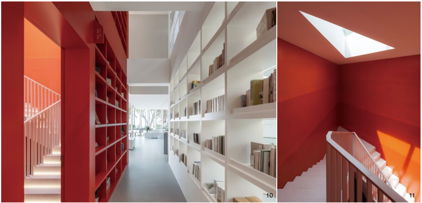
8. 天花板內部隱藏了消防與空調設備，確保建築的純粹感。9. 利用三角線條與建築盒子交錯，構成視覺張力。10. 梯區隱藏在火紅的書架牆中。11. 在梯間拾級而上時，能感受到日光將從三角形天窗灑落。12. 演講廳舞台的對角線上設置一個小高台，也是眺望點。