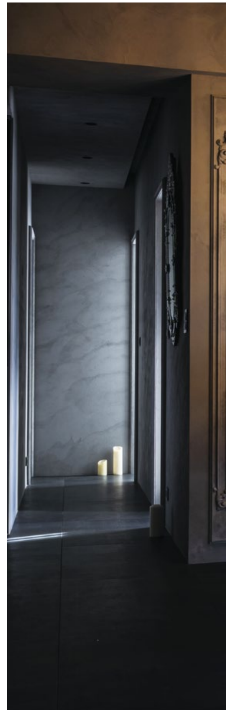
1. 玄關廊道，手刷的灰色背景在光色中顯得表情豐富。2. 用古典與現代的交織，實現都會住宅的童話構境。

這是業主與設計團隊的第二次合作，業主期待跳脫保守樣式，透過設計為生活帶來新氣象。40坪的空間擁有寬闊的發展可能與美好期許，在理解業主想望後，考量空間使用者並無幼兒，李中霖決定一切以成人的工學尺度與生活想望為依歸，他思忖，要為空間講述什麼樣的故事，體現業主對於家居品質與別致價值的重視，以及關於精緻品味的呈現？最後，定案以童話城堡作為概念，映現這座獨享疆域的價值。