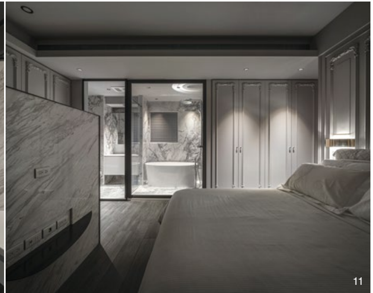
9. 主臥房採用大理石屏牆界定出梳妝、更衣區。10. 主臥衛浴隔間採用智能電控玻璃維繫隱私。11. 主臥房規劃比照飯店規格與精緻性。12. 女兒房，色調一致的背景將機能規劃整合得更加利落。13. 女兒房，現代簡約與古典元素相襯。14. 客廁，採用石紋鋪砌地面與立壁，配以鏡面置物櫃豐富空間層次。