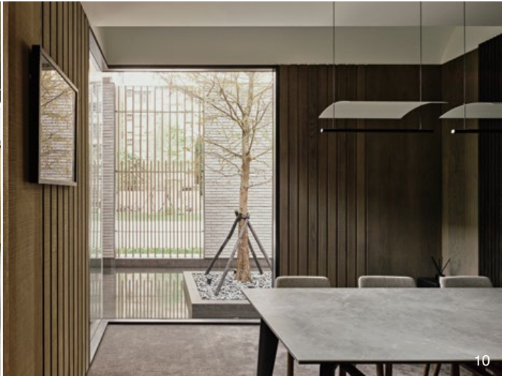
3. 在空地種植落羽松，除了綠化環境更能細微遮蔽建築，營造神祕感。4. 從員工停車場至室內的入口。5. 以「漂浮屋頂」的概念，遮擋三面視覺凌亂的老舊建築。6. 大廳以鋁板天花及大片玻璃窗，搭配整齊排列的線條裝飾，予人簡約的現代感。7.8. 實材與玻璃立面的搭配，讓視線在虛實間肆意徘徊，連接內外場域；特殊的屋頂造型引入多變光影。9. 透明玻璃與木色量體虛實交錯排列，提供空間勻稱視感。10. 室內以白與木色為基調，簡約而沉穩；通透玻璃能輕易看見室外場景。11. 平面圖。