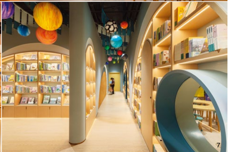
4.《文軒親子書店》不規則的弧形曲線空間，透過三個出入口的規劃互相串聯。5.場域之間豎立的圓型柱提供了書店的主題產品展示以及閱讀的座位功能。6.粉色的婦幼零售區。7.多功能教室，選用予人平靜的藍色調，天花板吊掛的星球裝飾，希望激發孩童學習的好奇心。8.紅色的多功能劇院。9.開放式廚房對面的長椅區用餐區。10.用餐區提供家長與孩童可以在此簡單用餐、補充體力與休憩。11.VIP區，以激光切割白色金屬板製成描繪花園洋房形狀，提供舉辦生日派對和研討會等活動使用。12.棕色的遊樂區，藉由多角度不鏽鋼鏡面天花板營造出視覺上的錯覺，彷彿置身在萬花筒般的世界。