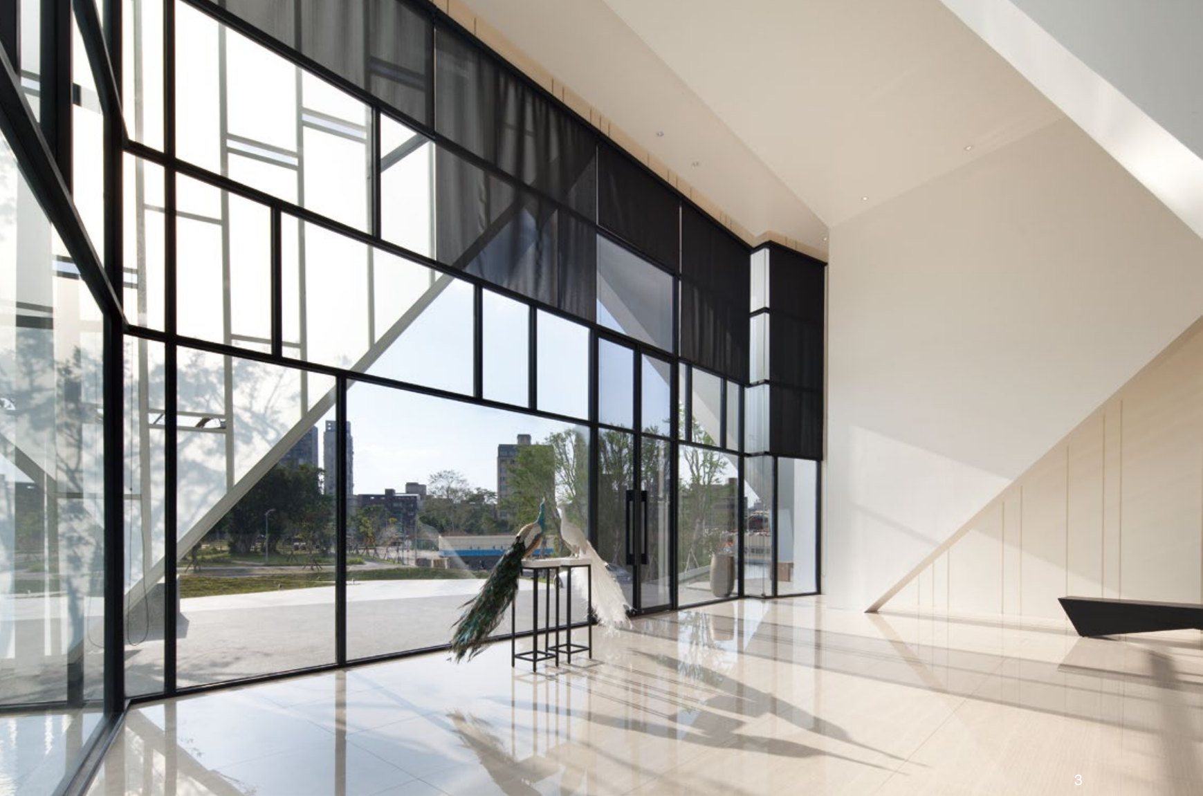
3. 內部空間以淡雅留白襯托出環境之美。窗框結構的疏密變化，豐富了立面表情。4. 大片玻璃面將自然光線引入室內，亦讓視景伸展至戶外環境，使空間顯得明亮寬敞。5. 空間延用建築外觀之特色，利用轉折稜線劃出迂迴路徑。6. 戶外露台與水景。